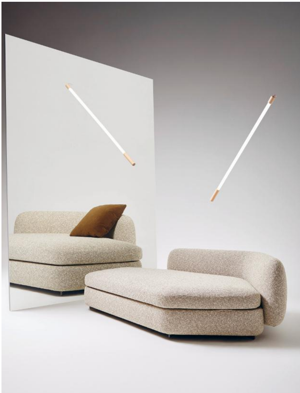
Divano Saint-Germain, Poliform , fa parte di un sistema di elementi imbottiti dalle forme sinuose, con cui si creano divani lineari, angolari o composizioni organiche. Schienale in poliuretano flessibile stampato, seduta in poliuretano espanso a quote differenziate, piedini in metallo verniciato brown nickel; rivestimento sfoderabile in tessuto o pelle. Design Jean-Marie Massaud : "Saint-Germain trasforma qualsiasi spazio in un paesaggio caldo e familiare, infondendo una piacevole sensazione di comfort domestico". Lampada Linea, Seletti , a luce led con terminali in legno. Design Selab + Alessandro Zambelli